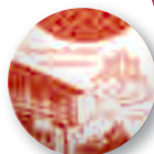
静岡市立芹沢銈介美術館