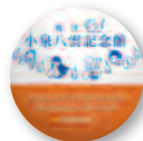
焼津小泉八雲記念館