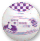
藤枝市郷土博物館・文学館