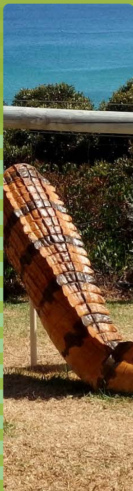
《クロコダイル・ファミリー》 2018